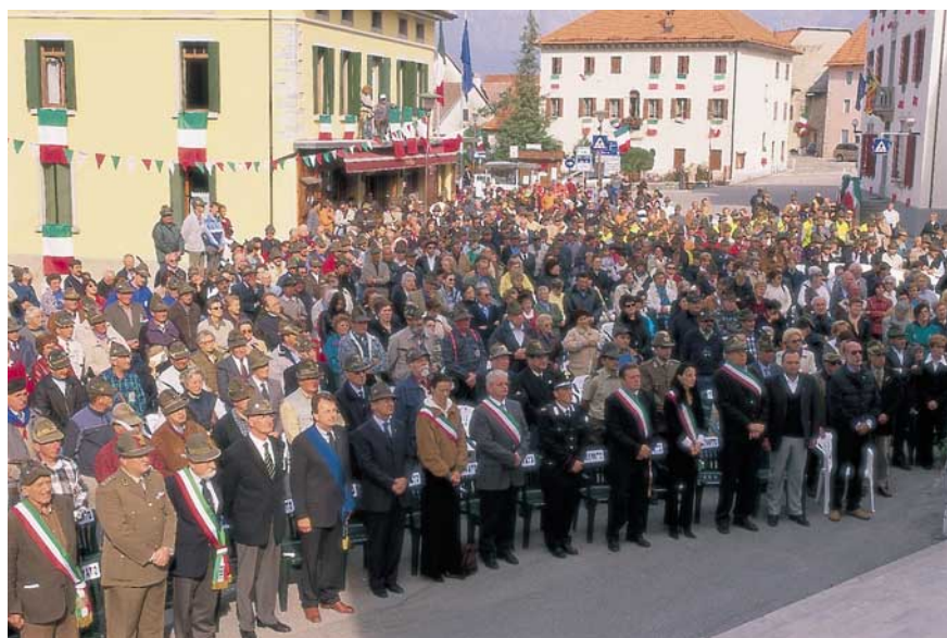
Cittadini, alpini e autorità durante la S. Messa nella piazza antistante la chiesa di Tambre.