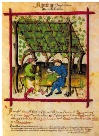
Una stampa tedesca in cui si insegnava a diraspere i grappoli d'uva ancora acerba per ricavarne l'agresto, condimento che veniva usato a tavola al posto dell'aceto.

Il vino greco era in realtà uno sciropo molto alcoolico e veniva corretto con acqua (anche di mare) e aromatizzato con spezie, miele e resine: chi lo beveva puro era guardato con disgusto. E nel caso del brutale Polifemo anche con sgomento: per metterlo al tappeto Ulisse, dovette propinarlo vino di Tracia non tagliato,