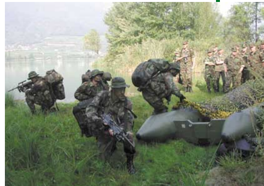
Un momento della dimostrazione dei rangers del btg. "Monte Cervino" agli ufficiali dell'Accademia svizzera (foto Comando Truppe alpine).

contesto della recente specializzazione "ranger". La visita è proseguita con una esercitazione alpinistica di tecniche di arrampicata e manovre di soccorso in parete organizzate in val Pusteria dal 6° rgt. alpini. Il primo ottobre presso la Brigata alpina "Julia" è stato mostrato l'addestramento del personale in preparazione della prossima "Cambrian Patrol", appassionante competizione organizzata annualmente in Gran Bretagna tra tutte le migliori specialità delle forze armate alleate, e vinta dagli alpini della "Julia" nelle ultime due edizioni. ●