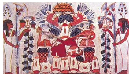
La raccolta dei grappoli sotto una pergola dell'Egitto faraonico.

Come una corona di pampini celebrante la gloria delle cosmogonie, delle religioni, delle invenzioni migranti dalla Mezzaluna Fertile, la vite vinifera, per la prima volta "sativa" (coltivata), muove lentamente verso l'Europa guidata dall'astro diurno ("il calor del sol che si fa vino"), dirà Dante, imponendosi sulla "silvestris" (incolta) ovunque dominante. Attecchisce mirabilmente sulle alture di Siria (i primi vini bianchi?) e di Palestina (gigantesco il grappolo di Hebron, inforcato su una stanga spalleggiata da due esploratori di Mosè!).