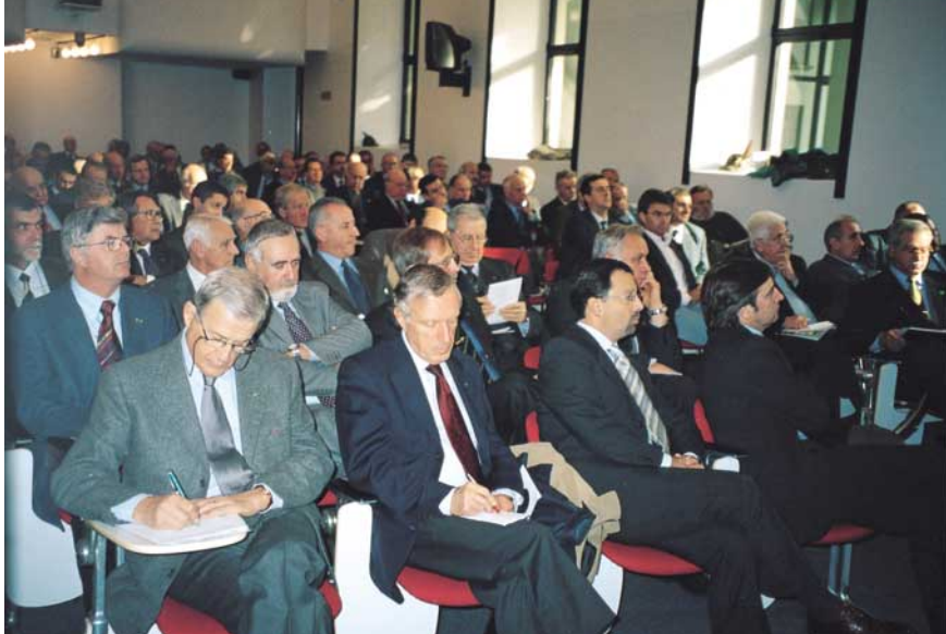
Uno scorcio della sala.

Protezione civile. Il nuovo coordinatore Gorza ne tratteggia la fisionomia secondo uno schema che riporteremo prossimamente. Anche qui numerosi gli interventi relativi al ruolo che riveste la nostra P.C.: c'è il timore che essa sia stata declassata e abbia perso di autonomia; non è vista di buon occhio la precettazione che potrebbe accavallarsi con quella dell'ANA; non pochi difendono la figura del presidente di sezione che sembra essere stato messo da parte.