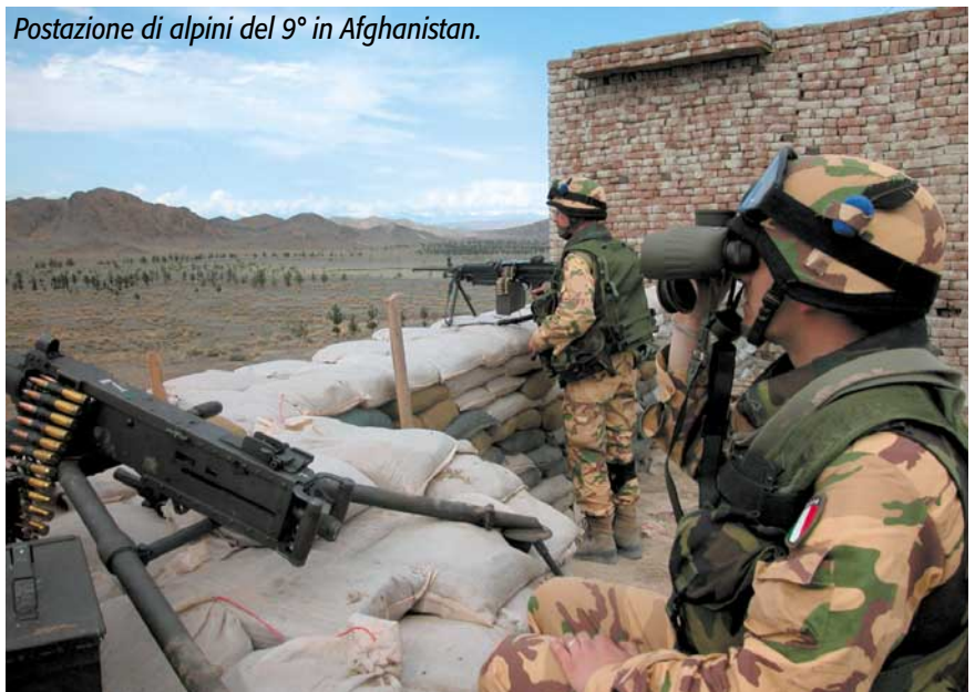
Postazione di alpini del 9° in Afghanistan.

In Afghanistan i militari italiani continuano a collaborare nell'operazione ISAF, che vede ancora impegnati a Kabul gli artiglieri da montagna del