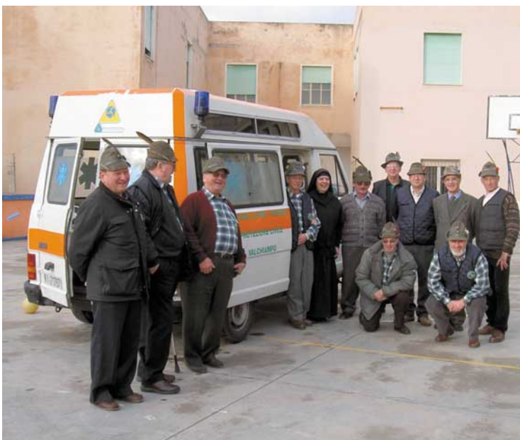
Nella foto un momento della cerimonia.

G li alpini del gruppo Monte Berico e della squadra di Protezione civile della Valchiampo hanno donato una autolettiga all'Istituto delle suore Evaristiane di Putzu Idu (a Oristano, in Sardegna). Si tratta di un istituto nel quale qualche anno fa gli alpini trentini eseguirono dei lavori di restauro. L'idea di donare un automezzo attrezzato all'Istituto, che si occupa dell'assistenza a ragazzi portatori di handicap e dista una quarantina di chilometri dal più vicino posto di pronto soccorso, rientrava da qualche tempo nei programmi degli alpini del "Monte Berico". Un proposito reso possibile grazie agli amici della squadra della Prote-