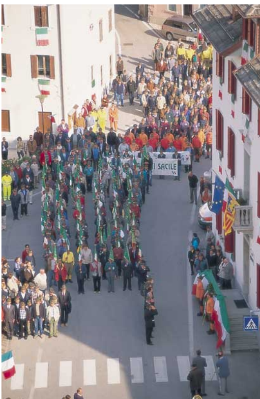
La sfilata per le vie di Tambre.