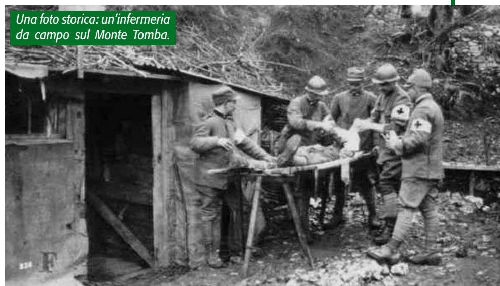
Una foto storica: un'infermeria da campo sul Monte Tomba.