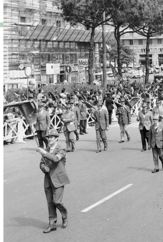
La sezione alla 46ª Adunata, nell'aprile del 1973 a Napoli.

I volontari partecipano anche alle esercitazioni - in termini di prevenzione - organizzate dal 2° raggruppamento (Lombardia e Emilia-Romagna); convenzioni costanti con i