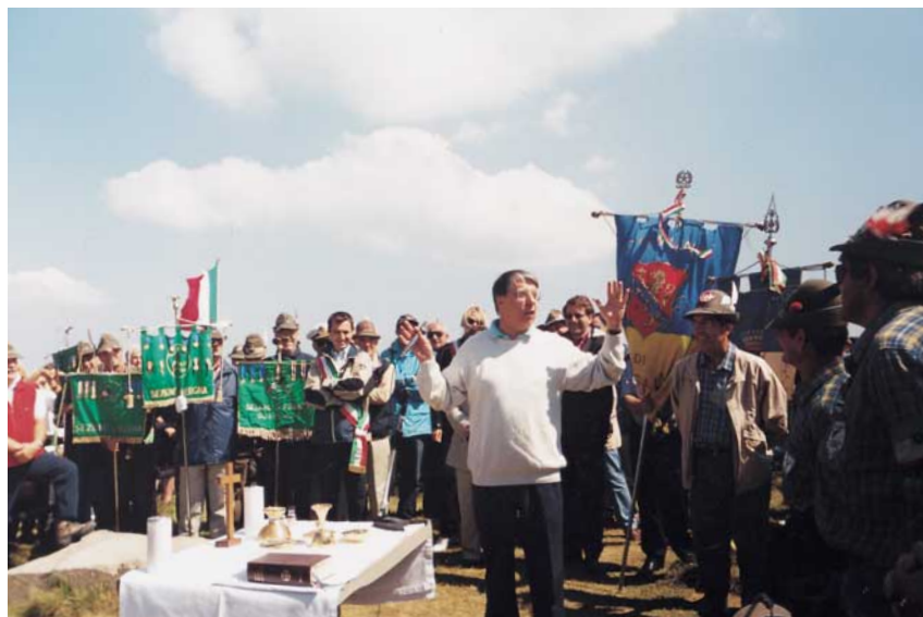
Un momento del pellegrinaggio al passo di Croce Arcana: porta il saluto agli alpini il ministro per i rapporti con il Parlamento Carlo Giovanardi.

economico, culturale, Modena apre una Scuola Militare di Fanteria che nel 1923 diventa Accademia Militare di Fanteria e Cavalleria. Con l'avvento della Repubblica, nel 1946, prende il nome di Accademia Militare e nel 1947 torna (eventi storici avevano disciolto, nel 1943, le Accademie di Torino e Modena) nella stupenda sede del Palazzo Ducale, opera settecentesca dell'architetto Bartolomeo Avanzini su fondamenta di un antico castello.