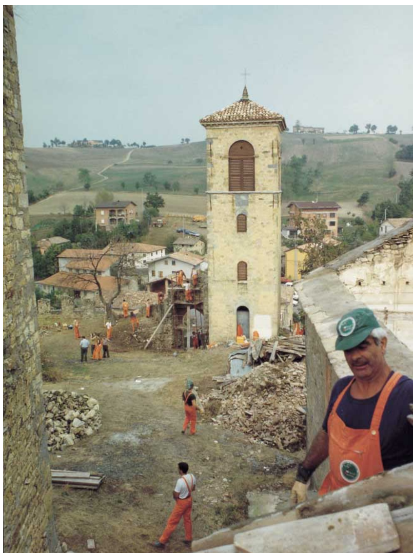
Un intervento di protezione civile in un paese dell'Appennino modenese.