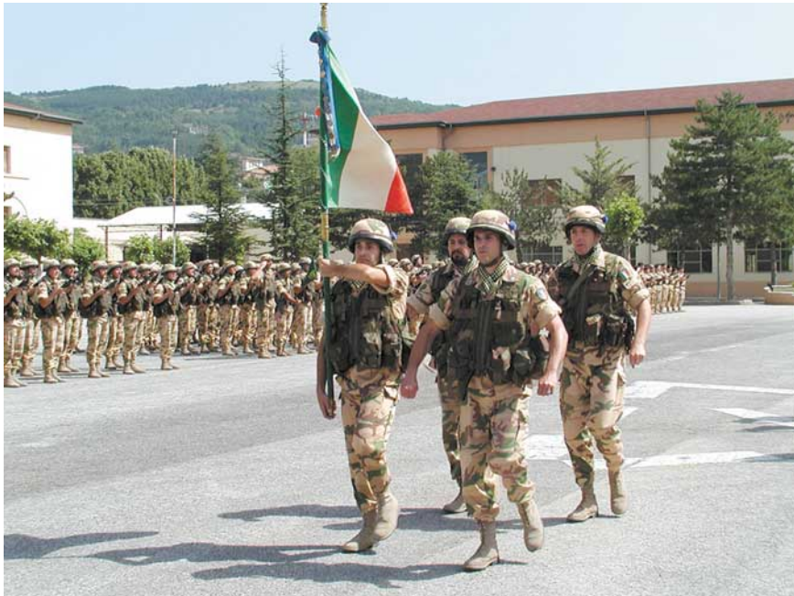
Sfila bandiera di guerra del 9° reggimento alpini.

Identico riconoscimento alla Bandiera del 187° reggimento paracadutisti "Folgore" e a quella dell'Aeronautica Militare