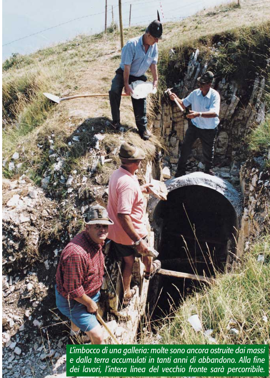
L'imbocco di una galleria: molte sono ancora ostruite dai massi e dalla terra accumulati in tanti anni di abbandono. Alla fine dei lavori, l'intera linea del vecchio fronte sarà percorribile.

territorio italiano e, più in generale, al comune ricordo delle vittime della Grande Guerra, compreso il fenomeno tristissimo degli internati civili. Non solo, ma ci sono altri tre elementi a motivare questa opera: il 75° anniversario della fondazione del gruppo di Possagno, il 40° della ricollocazione della croce votiva voluta dalle penne nere al Rifugio di Monte Palon e il ventennale della costruzione del rifugio stesso.