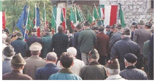
La commemorazione alla chiesetta degli alpini a Montecchio Maggiore.