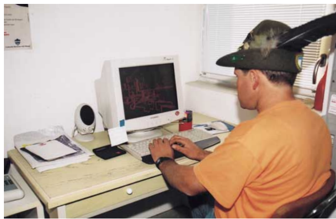
Il locale mungitura automatizzato e la sala controllo qualità del latte e degli altri prodotti.