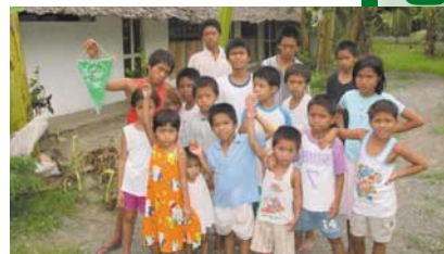
Il gagliardetto del "Gruppo Como" sventola anche nelle isole Filippine.