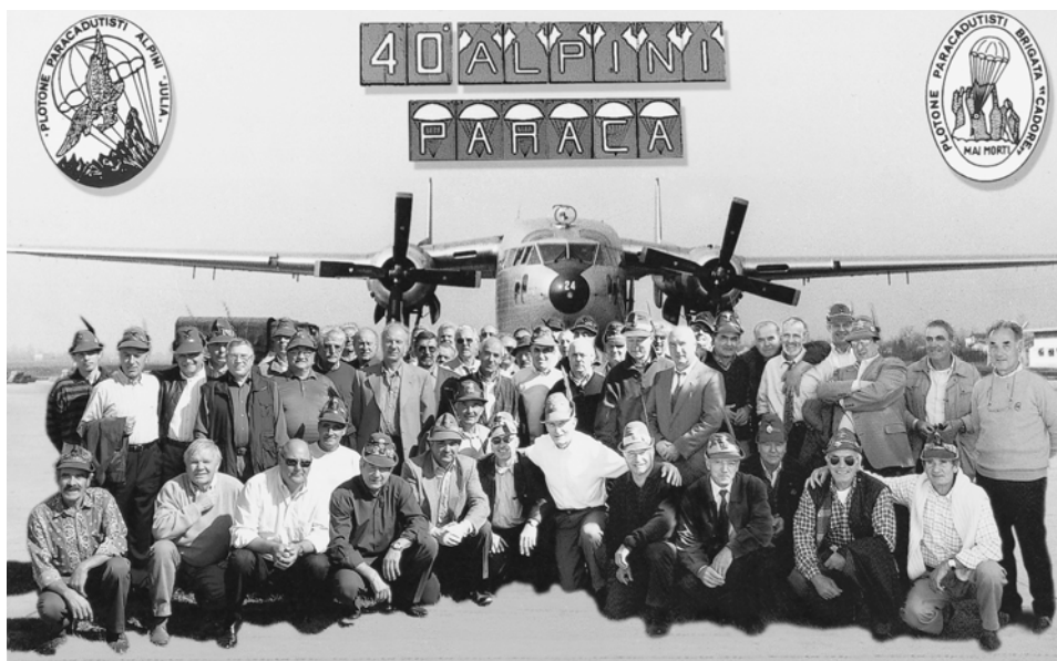
Foto di gruppo degli alpini paracadutisti della "Cadore" e della "Julia", 3°/'39 che si sono ritrovati a Pastrengo (Verona). Nel '61 erano al CAR di Pisa.