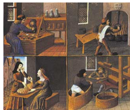
Momenti di vita: in basso a destra la torchiatura e pigiatura dell'uva. Nelle altre tavole: la pittura, la cucina, le erbe.

E finalmente nel 1863, dopo millenni di... bevute, si venne a sapere, grazie a Pasteur che scoprì gli agenti della fermentazione, perché il succo dell'uva si trasforma in vino. Nessuno