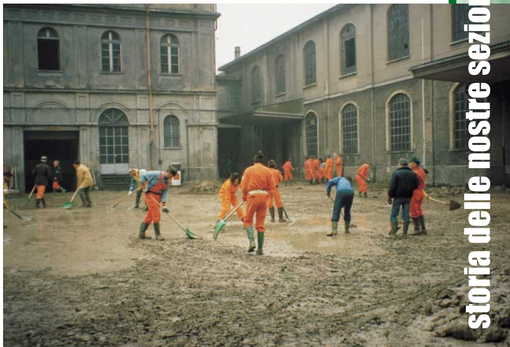
Volontari della Protezione civile sezionale durante l'alluvione in Piemonte.

Capitale del Ducato Estense dal 1598, importante centro politico,