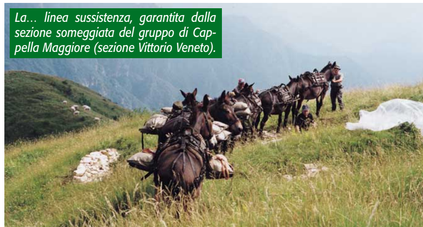
La... linea sussistenza, garantita dalla sezione someggiata del gruppo di Cappella Maggiore (sezione Vittorio Veneto).

Attrezzi per i lavori? L'unico a motore è stato un mini escavatore; poi, picconi, badili, mazze, leve, carriole, e quindi, come sempre, tanto... olio di gomito! Tutto, per rendere omaggio alla memoria di combattenti che, come ricorda la targa apposta presso il rifugio ("Caposaldo 1308"), furono la 1118ª compagnia bersaglieri mitraglieri Fiat, e quindi l'8º e il 9º reggimento Alpini dell'80ª divisione, con nomi quali Aosta, Monte Antelao, Pieve di Cadore, Val Cismon, Monte Pelmo, Monte Suello, Monte Cervino, Cividale, e via elencando. Storia nostra, storia d'Italia, che non deve essere dimenticata. ●