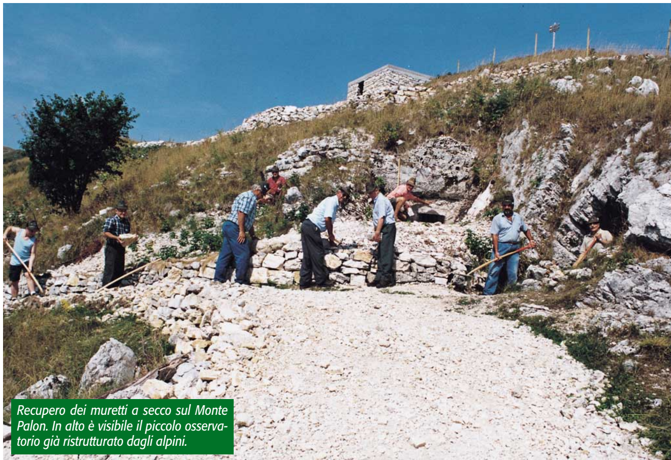
Recupero dei muretti a secco sul Monte Palon. In alto è visibile il piccolo osservatorio già ristrutturato dagli alpini.