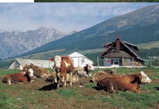
Il complesso dell'azienda agricola della cooperativa "Monte Cavallo".

trovati sabato 27 e domenica 28 settembre per festeggiare la cooperativa "Monte Cavallo", cui è stato consegnato il "Premio fedeltà alla montagna", il riconoscimento che dal 1981 l'A.N.A. assegna a quanti con il loro lavoro mantengono vive le tradizioni alpine e contribuiscono alla salvaguardia e valorizzazione della montagna.